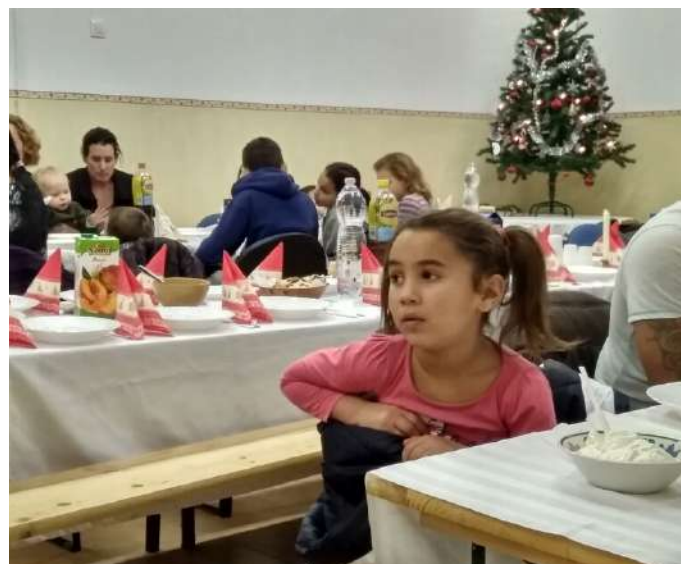
Karácsonyi vacsora Dombostanyán, az alapítvány által támogatott rászorulóknak számára